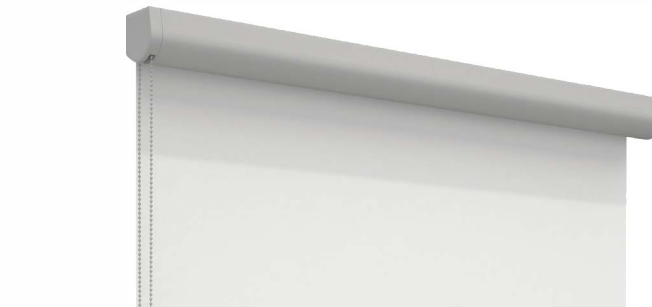
XL-Rollo mit R-Kassette XL-Flächenrollo mit Kassette