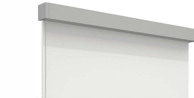
Basic Rollo mit Eckkassette XXL-Rollo mit Eckkassette